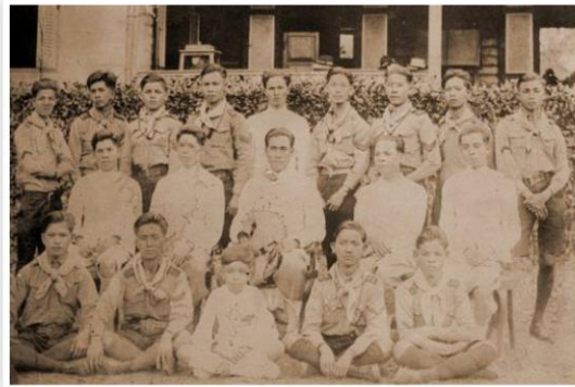
คุณครู และลูกเสือ กองเสือป่า โรงเรียนมัธยมโยธินบูรณะ

“เช้าวันรุ่งขึ้น วันที่ 25 มิถุนายน 2478 รู้สึก ตื่นเต้นมาก ตื่นตั้งแต่ตี 4 รีบอาบน้ำแต่งตัว เลือก เสื้อผ้าชุดที่สวยงามที่สุด (กางเกงขาวสีขาวย สีอ่อนอก สีตะเข็บ) ออกจากบ้านมาลงเรือที่ทำน้ำเที่ยวแรกเวลา 5.30 น. เรือมาถึงท่าเขียวไข่กา (บางกระบือ) เวลา 8.30 น. ความจริงเรือเที่ยวนี้จะมาถึงท่าบางกระบือ เพียง 07.44 น. บังเอิญเครื่องเสียจึงถึงช้าไปมาก ขึ้น รถรางจากท่าเขียวไข่กาถึงที่โค้งบางกระบือ สมัยนั้น โค้งบางกระบือเป็นชุมทางใหญ่ พอรถจอดส่งผู้โดยสาร เจ้าหน้าที่ขับรถรางจะตะโกนบอกผู้โดยสารว่า